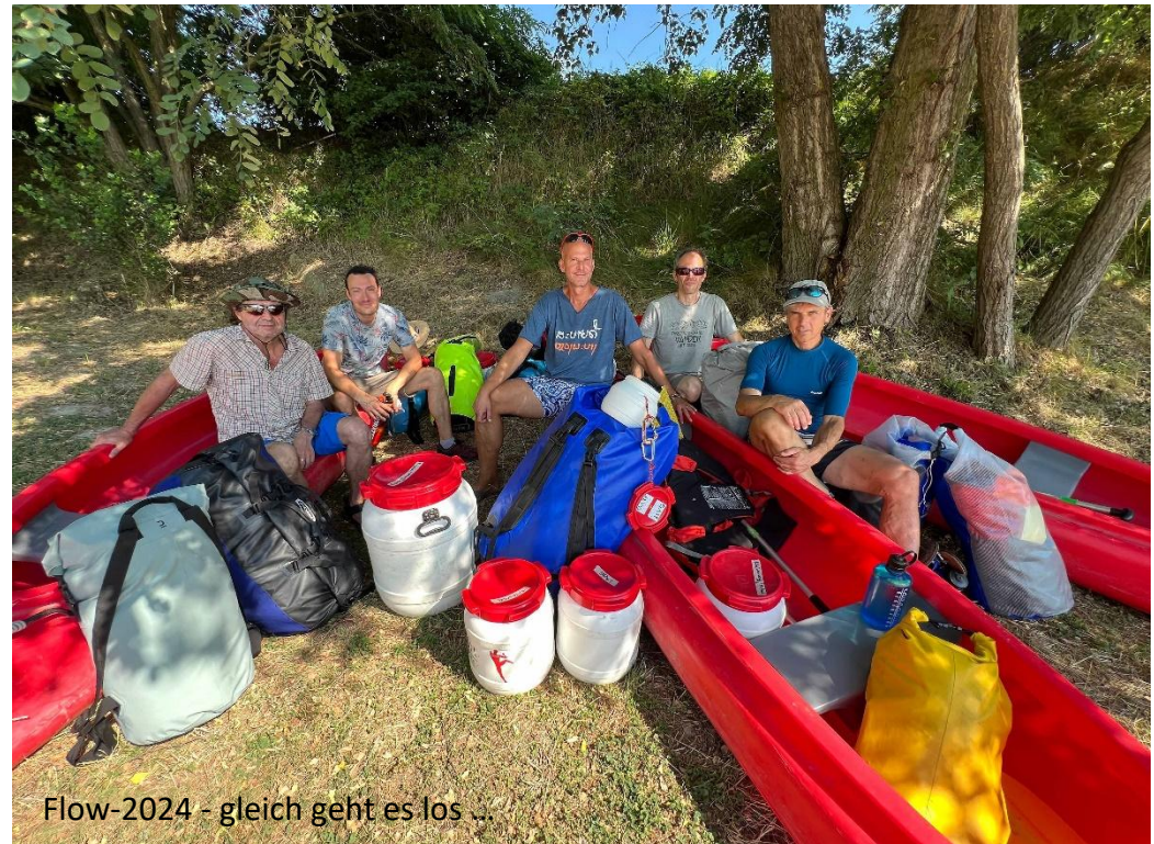
Flow-2024 - gleich geht es los ...