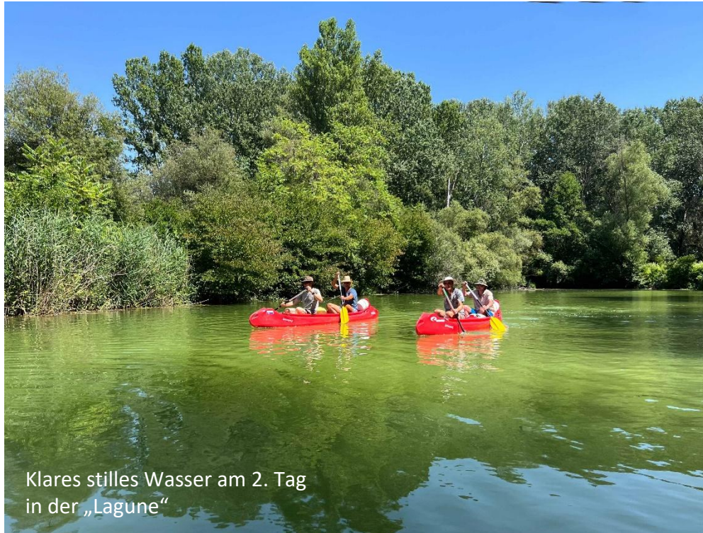
Klares stilles Wasser am 2. Tag in der „Lagune“

„Dieses Seminar hat alle meine Erwartungen erfüllt und übertroffen. Das Paddeln mit den anderen Männern in den ungarischen Donauauen und das Campen in der Natur (wo ich sonst kein Camper bin) hat mir das Gefühl gegeben, eins mit der Natur zu sein und hat mir ermöglicht, ganz zu mir zu kommen und mich und meine Kraft zu spüren – körperlich und seelisch. Der Austausch mit euch als Coaches und auch mit den anderen Männern in der Gruppe war sehr offen und ehrlich, und ihr habt eine sehr wertschätzende und behutsame Umgebung geschaffen, die das ermöglicht hat. Wir haben gemerkt, dass wir vielfach ähnliche Herausforderungen haben, wir konnten aber auch von unseren gegenseitigen Lebenserfahrungen lernen. Und ich hatte Spaß wie ein kleiner Bub, beim Paddeln, beim ins Wasser springen, beim Schwimmen, beim Roden für die Zeltplätze, beim Feuermachen und bei den kleinen „Bootsgefechten“ 😊. Kurz gesagt: Es hat alle Saiten in mir zum Schwingen gebracht. Ich bin jetzt wieder voller Energie, und habe nun auch schon viele Ideen für meine Fragestellung, mit der ich aufs Seminar gekommen bin, wie ich mich beruflich in den nächsten Jahren entwickeln will. Ich habe diese Erfahrung von mir als Mann unter anderen Männern, die in der Natur auf sich selbst gestellt sind, sehr genossen, ein Erlebnis, das man im normalen Alltag nicht erleben kann. Ich kann es nur jedem Mann empfehlen, das ist ein einmaliges Erlebnis!“ (Andy, Juli 24)